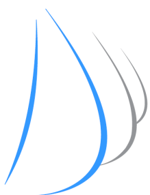
Pálavská regata 2013 120 let jachtingu v Čechách

To všechno je jachting. Jachting je životní styl.